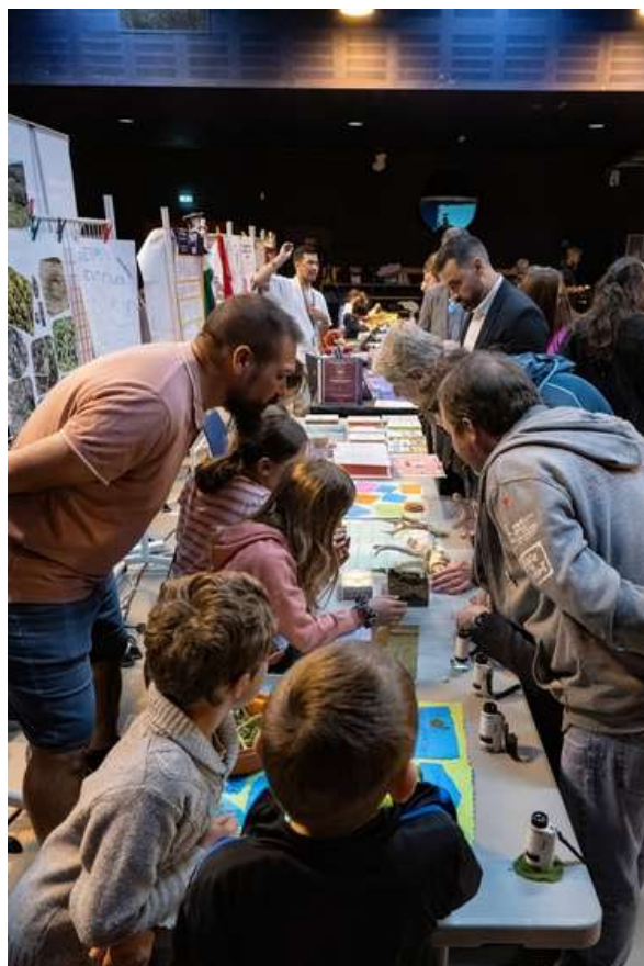
Projets de jeunes (ci-dessus)