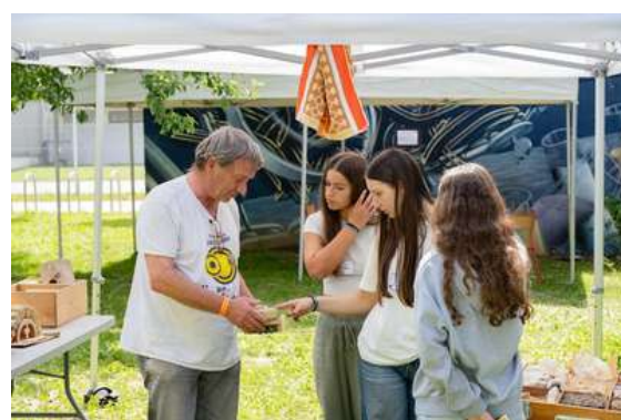
Atelier "Construction habitat écologique" par ARESO